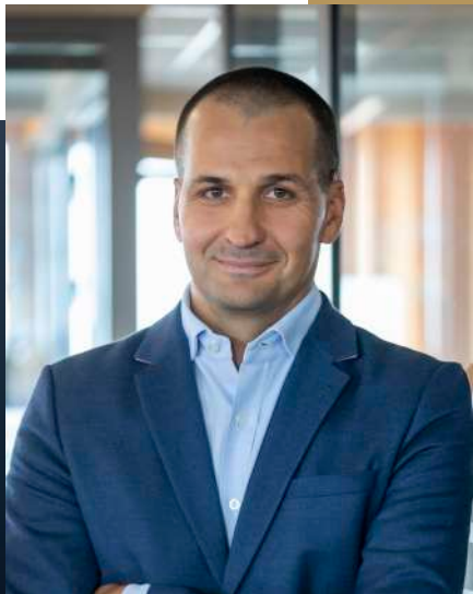
Prezes Zarządu Rainbow Tours SA

Tobie i Zarządowi oraz wszystkim Członkom ITRP, z okazji 15ego jubileuszu działalności, życzę dalszych sukcesów w dążeniu do wyznaczonych celów, oraz realizacji kolejnych ambitnych zamierzeń. Jednocześnie pragnę serdecznie podziękować za dotychczasową współpracę, Mam nadzieję, że kolejne lata będą pasmem samych sukcesów.